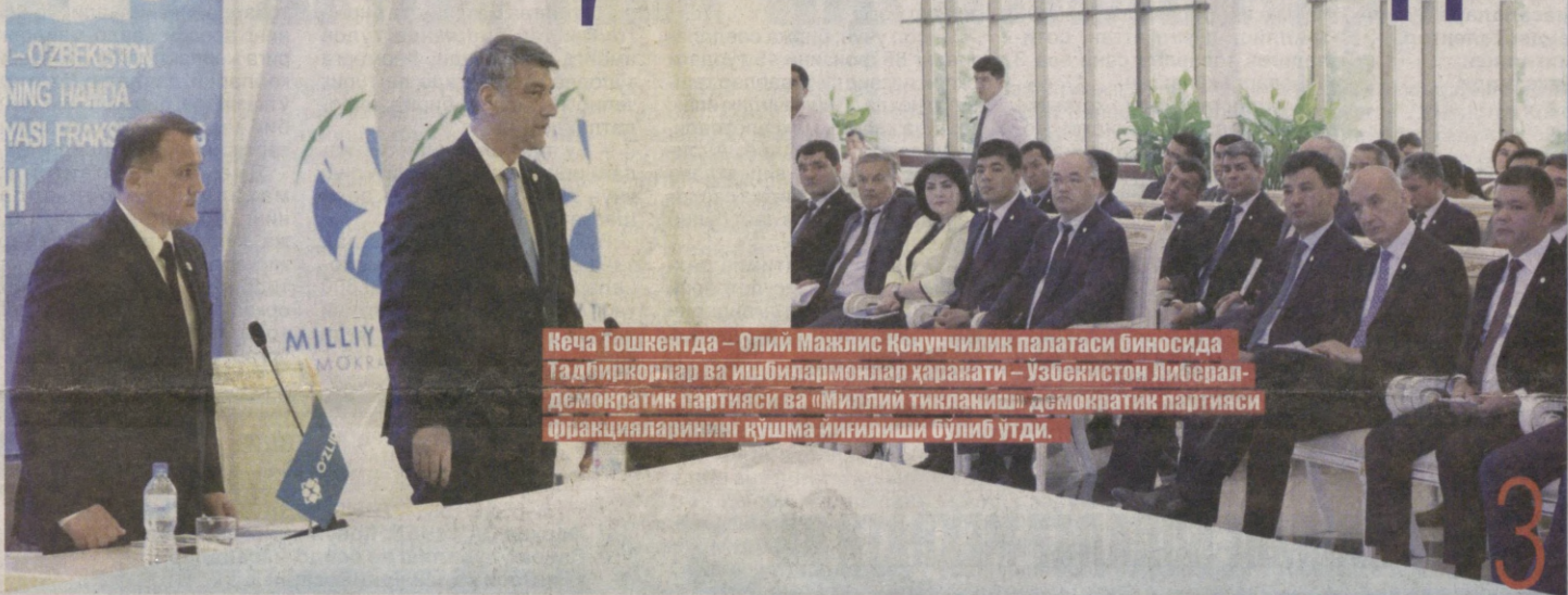
Кеча Тошкентда – Олий Мажлис Қонунчилик палатаси биносида Тadbиркорлар ва ишбилармонлар ҳаракати – Ўзбекистон Либерал-демократик партияси ва «Миллий тикланиш» демократик партияси фракцияларининг қўшма йиғилиши бўлиб ўтди.