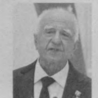
Иброҳим ҚОҒУРОВ, Ўзбекистон Қаҳрамони, адабиётшунос олим

— Узоқ истибоддан кейин мустақиллик ўрнатилган, жамиятда демократик ислохотларни амалга ошириш, бунинг учун эса демократик асосларни яратиш эҳтиёжи туғилган эди. Демократик асослар деганда жамиятда сиёсий партияларнинг ҳаракати, уларнинг изчил фаолияти оммани турли, айтиш мумкинки, ранг-баранг йўналишларга, ғояларга жалб қилиш тушунилади.