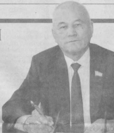
Тажибай РОМАНОВ, Қорақалпоғистон Республикаси Кенгаши раиси, Жўқорой Кенгесдаги партия фракцияси раҳбари

томонлама қўллаб-қувватлашни, аъзоларининг қонуний манфаатларини ҳимоя қилишни ўзининг энг муҳим вазифаларидан деб ҳисоблайди. Бинобарин, юртимизда амалга оширилаётган ислохотларни нафақат қўллаб-қувватлаётган, балки уларнинг фаол ташаббускори сифатида ҳам илдам қадам ташляётган. Партиямизнинг барча бўғинларидаги фидойи вакиллари, айниқса, депутатларимиз бундан буён ҳам миллий юксалиш йўлида ўзларининг бор имконият ва кучларини сафарбар этаверадилар. Фурсатдан фойдаланиб, барча партиядошларимизни қутлуғ 27 ёшлари билан муборакбод этаман!