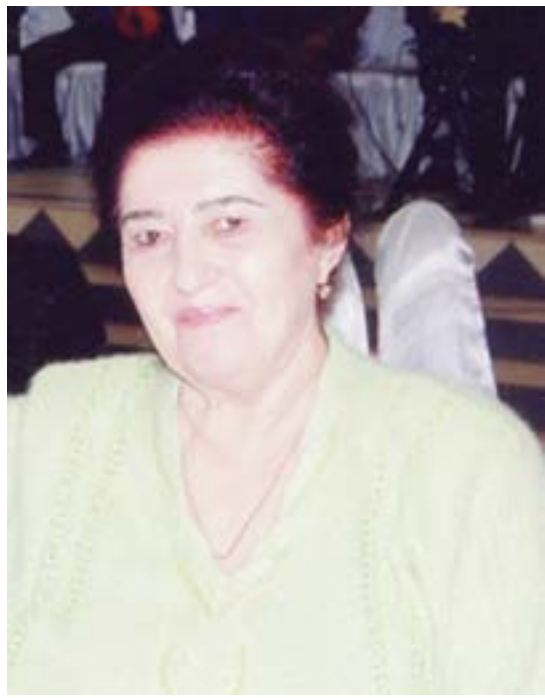
◆ Касаба уюшма фахрийлари