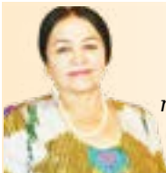
Ҳосият БОБОМУРОДОВА, Самарқанд халқаро технология университети профессори, шоира

Давралар сиз билан мукамал, кўркам, Ақду меҳр ила ҳаммага бошсиз. Юртини деганлар юзга қираркан, Сиз ҳали саксон беш, жуда ҳам ёшсиз!