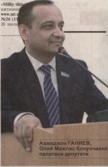
Ахмаджон ҒАНИЕВ, Олий Мажлис Қонунчилик палатаси депутати