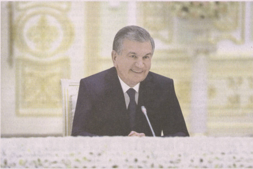
Президент Республики Узбекистан Шавкат Мирзиёев 17 мая принял директора-распорядителя Международного валютного фонда Кристин Лагард, находящуюся в нашей стране с официальным визитом.

Тепло приветствуя высокую гостью, глава нашего государства с глубоким удовлетворением отметил поступательное развитие конструктивного диалога и взаимовыгодного сотрудничества между Узбекистаном и МВФ.