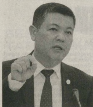
Нодир ТИЛАВОЛДИЕВ, Олий Мажлис Қонунчилик палатаси депутаты

Норасмий меҳнат нафақат мамлакат иқтисодиётига, балки инсон ҳаёти ва соғлигини хавф остига қўйишга ҳам олиб келади. Энг ёмони, инсон кексайганида ёки меҳнатга лаъқатсиз бўлиб қолганида уни ижтимоий ҳимоясиз қолдиради.