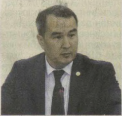
Руслан ЖУМАМУРАТОВ, Олий Мажлис Қонунчилик палатаси депутаты