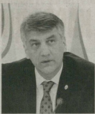
Алишер ҚОДИРОВ, Олий Мажлис Қонунчилик палатаси Спикерининг ўринбосари, Ўзбекистон «Миллий тикланиш» демократик партияси Марказий кенгаши раиси

Инсоният миллионлаб қурбонлар эвазига эришган муваззатини ҳақлигидан шубҳа қилмаётган йирик давлатлар ўз манфаатлари йўлида «уйин қилаётган» бир вақтда, 15 та давлат ва 10 дан ортқ халқаро ташкилот раҳбарлари жам бўладиган ШХТнинг Самарқанд саммити муҳим хулосалар учун имкониятга айланиши кутилмоқда.