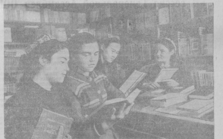
В ряде районов Самаркандской области в «Неделе детской книги» организованы средние школы № 1 имени Молотова, нижнего райага «Уабенингора».

Под таким заголовком в «Правде Востока» 6 марта с. г. было напечатано письмо в редакцию, в котором говорилось о плохой работе Пенкентского районного культпросветотдела. Как сообщил редакция секретарь Пенкентского районного культпросветотдела тов. Кретов на сессии районполкома освобожден от занимаемой должности. Районный комитет партии принял соответствующие меры для улучшения культурно-просветительской работы в районе.