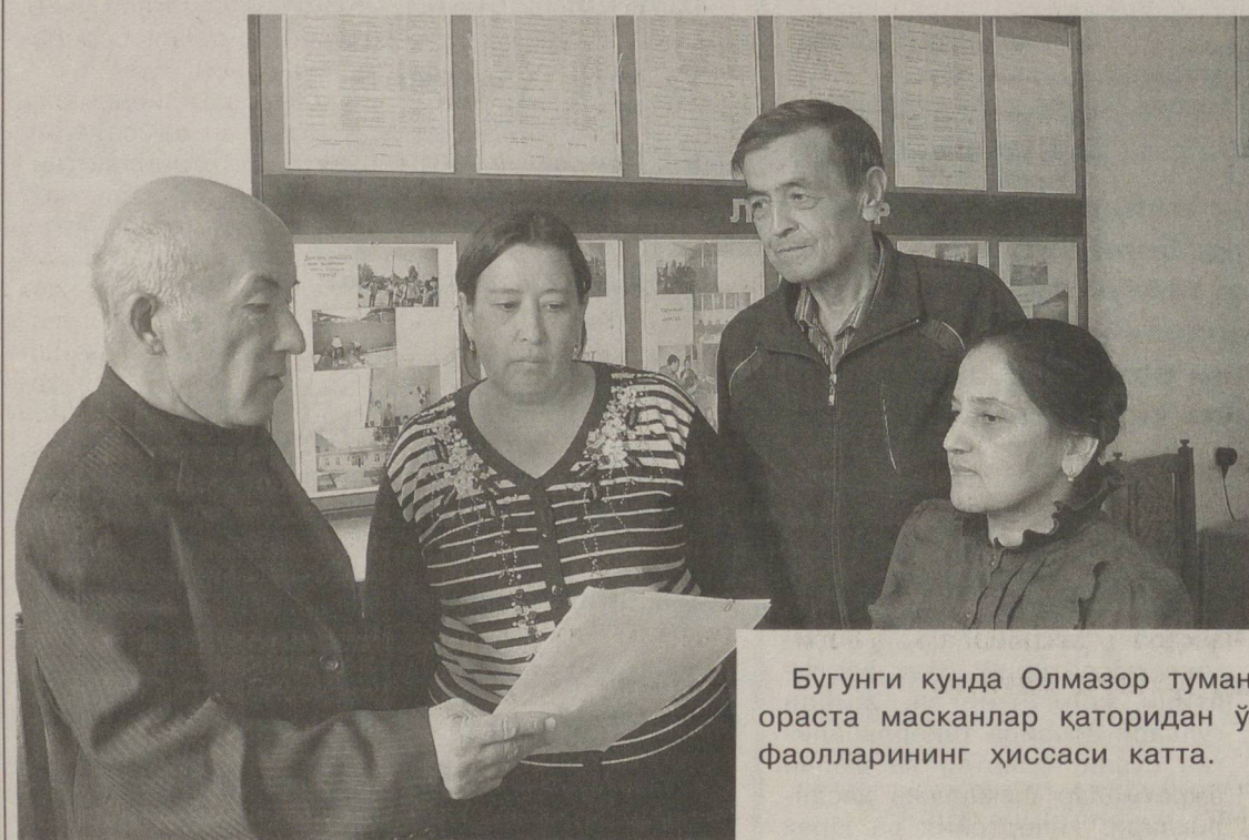
Бугунги кунда Олмазор туманидаги «Қорасарой» маҳалласи кундан-кунга чирой очиб энг обод ва ораста масканлар қаторидан ўрин олмоқда. Бунда албатта маҳалла фуқаролар йиғини раиси ва фаолларининг ҳиссаси катта.