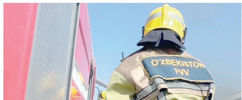
Воҳиджон ҳеч кимга билдирмай кўшни хоналар ва айвонга ёнилги сеипб чиқади-да, сўнг ёкиб юборади. Кейин у кўчага чиқиб, аммасининг ўғлига қўнғироқ қилади ва уйга ўт қўйганини айтади.

Демак, бундан кўринадики, ҳар бир оиланинг аҳил-иноқ ва тотувлиги турли хил низо ва қелишмовчиликларни ўз вақтида бартараф этиш, оила аъзоларининг бахтиёр яшашини таъминлашнинг муҳим шарт эканини унутмайлик.