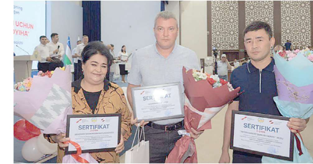
Маълумот учун, 1-ўринни қўлга киритган "Саховат-1998" МЧЖ оилавий тадбиркорлиқни ривожлантириш дастури доирасида 33 млн. сўм имтиёзли кредит олиб, текстиль маҳсулотларини ишлаб чиқариш фаолиятини йўлга қўйган.

Маълумот учун, 1-ўринни қўлга киритган "Саховат-1998" МЧЖ оилавий тадбиркорлиқни ривожлантириш дастури доирасида 33 млн. сўм имтиёзли кредит олиб, текстиль маҳсулотларини