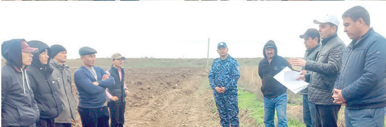
Ер олган ёшлар “Бир маҳалла — бир маҳсулот” тамойили асосида қовун экканди. Айни пайт ҳосил даромадга кирди. Тахминий ҳисоб-китобга кўра, 50 сотих ердан ҳар бир ёш 15 миллион сўм даромад кутяпти.

олинган. У 33 миллион сўм кредит ҳисобига наввойчилик ҳамда тадбиркорлик фаолиятини йўлга қўйди. 4 нафар тендошини иш билан таъминлади.