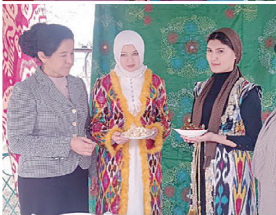
Куда тароф билан учрашиб, ёшларни бахтли яшашиға яна бир имкон беришиға келишдик.