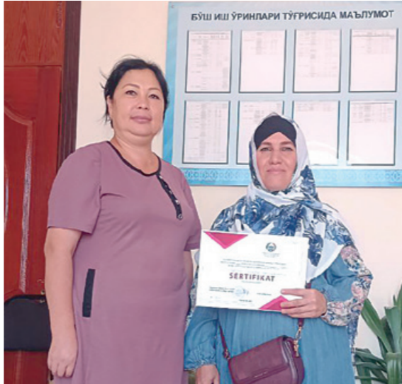
“Аёллар дафтари”га киритилган 14 нафар хотин-қизга субсидия асосида тикув машиналари берилди.

Шундай ҳолатларни олдини олиш учун турмуш қуришдан аввал келин ва кўёв ўртасида никоҳ шартномасини тузиш тартибини йўлга қўйишни таклиф қилган бўлардим. Бир неча йилдан буён бу таклиф илгари сурилаётгани билан ҳали амалда ўз тасдиғини топгани йўқ. Шу масалани жиддийроқ ўйлаб кўриш вақти келди, назаримда.