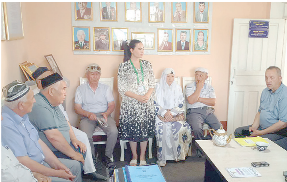
Шундай оилаларга имкон қадар кўпроқ ёрдам бергим келади. Уларнинг дарду ташвишини ўзимникидек қабул қиламан. Айримлари билан соатлаб сўхбатлашиб ўтиришга ҳам эринмайман. Мухими, далда бўлсам, бирор мушқулини осон қилсам бўлгани.

Фаолиятим давомида 5 та кейс очиб, фуқароларнинг турли муаммоларига ечим топишда кўмаклашдик. Бир аёл турмушидан ажришиб, 2 нафар фарзандини онасига қолдириб қайта оила қуради. Болаларга бувисини расман васий этиб тайинладик. Шундан кейин улларга нафақа пули бериладиган бўлди. Маҳалла ва ҳомийлар доимий равишда моддий жиҳатдан қўллаб-қувватлаб келмоқда. Бу оила бир хонали ижтимоий ётоқхонада истиқомат қилади. "Саховат ва кўмак" жамғармасидан ёрдам олиб, эшик ва деразаларини алмаштириб беришни режалаштирганмиз. Бундан ташқари, катта набирасини инглиз тили ва математика фанидан бепул тўғаракка жалб қилмоқчимиз. Боғчага борадиган набираси тўловни