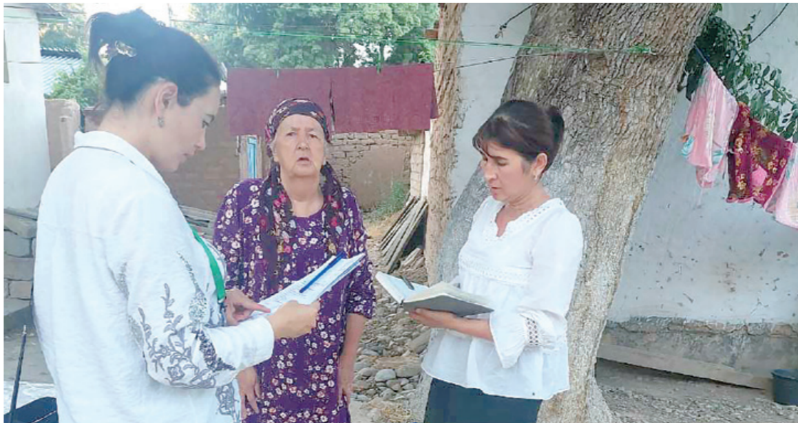
Худудимиздаги ҳар бир оила ўз яқинларимдек бўлиб қолган. Кимга қандай маслаҳат, йўл-йўриқ керак бўлса, бемалол келиб мурожаат қилади.

50 фоиз чегирма билан амалга оширяпти. Худудимиздаги ҳар бир оила ўз яқинларимдек бўлиб қолган. Кимга қандай маслаҳат, йўл-йўриқ керак бўлса, бемалол келиб мурожаат қилади. Уртадаги самимий муносабат, дўстона муҳит қўллаб муаммоларни ижобий ҳал қилишга замин яратмоқда. Айрим оғир ижтимоий вазиятга тушиб қолган фуқароларнинг ҳужжатлар жалб боғлиқ муаммолари мавжуд. Кимдир паспортини