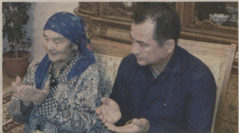
Она дуоли — ижобат

— Китеб деганда, афсуски, биз кейинги пайтларда муқова орасидаги нимачи бўлса шулу тушунадиган бўлди. Китеб — қозғолар тўплами эмас, китеб асл тарбия воситасидир. Ҳозиргина айтиб ўтганимиздек, маънавият-