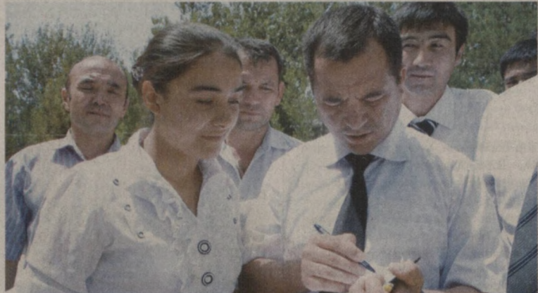
Шеърят ихлосмандлари билан

Дарёга бош қўшган ариқдай Ҳақ билан бўл, халқ ичинда бўл! Пешонангга не бор — билмассан, Балки мансоби майдан мастсан. Халқ бўлмаса, ҳеч ким эмассан! Ҳақ билан бўл, халқ ичинда бўл! Бугун бизда дунёнинг кўзи, Минг йилда бир довр келар ўзи. Урмасин-а халқнинг нон-тузи, Ҳақ билан бўл, халқ ичинда бўл! Адолатдан тарози бўлса, Ҳам ҳақиқат ҳамрози бўлса. Ҳақ розидир халқ рози бўлса, Ҳақ билан бўл, халқ ичинда бўл!