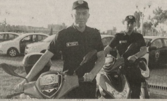
миллиард-миллиард сўм маблағини тежаб қолган бўламиз.

— Президентимизнинг юқорида тилга олинган ҳар икки фармонида ҳам масаланинг айни шу жиҳатида алоҳида эътибор қаратилган. Масалан, “Сув таъминоти ва сув чиқариш хизмати кўрсатиш соҳасида тўлов интизомини тубдан такомиллаштириш чора-тадбирлари тўғрисида”ги фармонда мамлакатимиз Халқ таълими, Олий ва ўртаққозо этади. Бир тасаввур қилиб кўринг: бир киши агар 15 ватт-ли ёриткичи бир соатга беҳуда ёқишдан сақланса, бир кунда 0,015 киловатт, бир ойда 0,45 киловатт, бир йилда эса 5,4 киловатт-соат энергияни тежайди. Энди бу рақамни Тошкент шаҳрида яшаётган уч миллионга яқин аҳолига қўпайтириб кўринг: