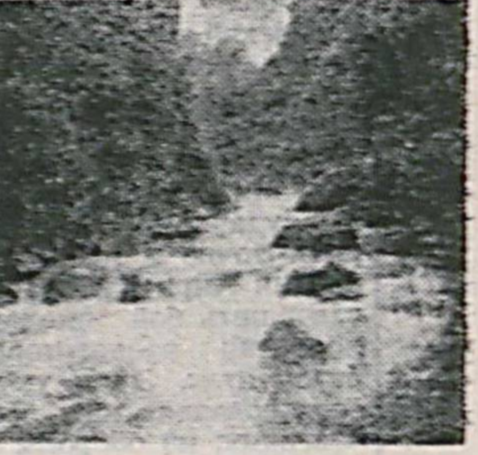
Замовавий тадқиқотчилар, Витрувий ёган маълумотларни, унинг фантазия маҳсули деб ҳисобламаликни таъкидладилар.

бора сув ича борми, бир умрга ҳушёрлигича қолади. Кишини оролидаги қўлда эса қўрқинчли хавф мавжуд эканлигини Витрувий айтган. «Ундан бир томчи сув ичган инсон, ўзлигини йўқотади. Агарда кимда-кимнинг қўшиқчилик мавқега эришиш нияти бўлса, Магнесиядаги сувдан ичиши даркор, унда ақойиб воналчилик қобилияти пайдо бўлади. Персиядаги чашмадан сув ичиб, барча тишларини йўқотиш мумкин».