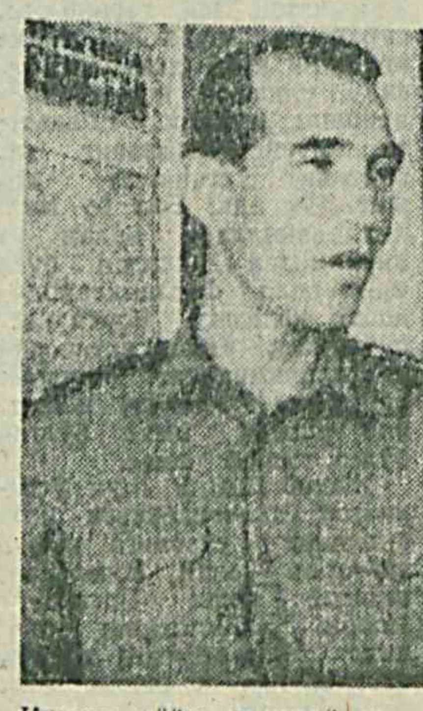
Қутлуғ айём, тарихий санаи жоноқон Узбекистонимиз мустақиллиги беш йиллиги таштаналарига ҳам оз кунлар қолди...

ақлоқ ўз ифодасини топган. Катта таърибага эга командир ўз кўл остидагиларининг барча ўқув машғулотлар бўйича юксак тайёргарликка эришилганини йўналиш тунуқу филоли хизмат қилиб келаяпти.