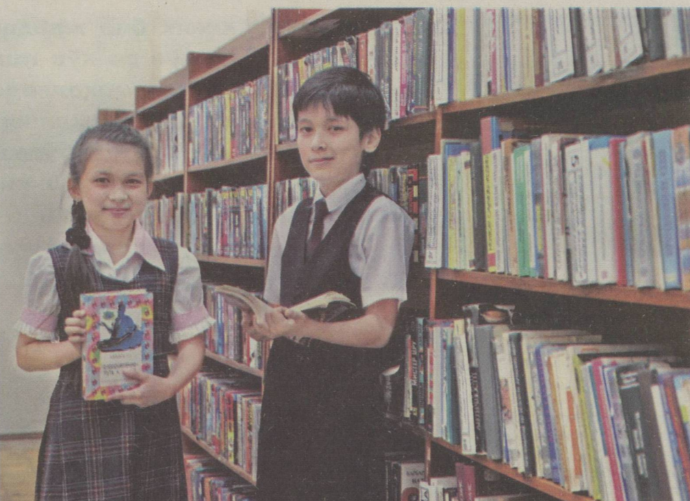
ЎзА олган суратлар