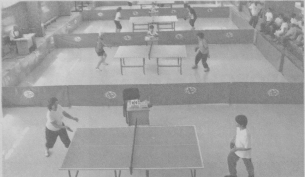
Термиз шаҳрида Ватанимиз мустақиллигининг 20 йиллигига бағишлаб «Буюк ва муқаддасан, мустақил Ватан!» шiori остида ўтказилган VI Республика аёллар спорт фестивали якунланди.