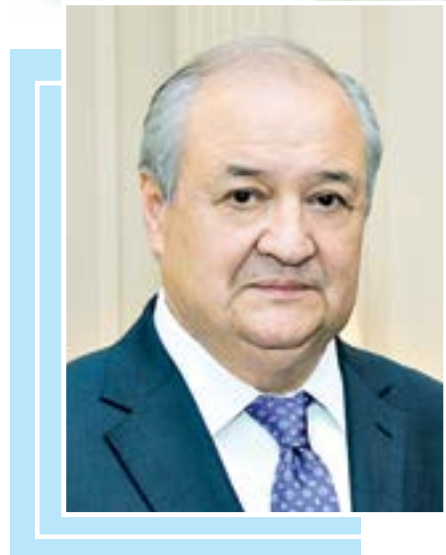
Abdulaziz KOMILOV, O'zbekiston Respublikasi Prezidentining tashqi siyosat masalalari bo'yicha maxsus vakili