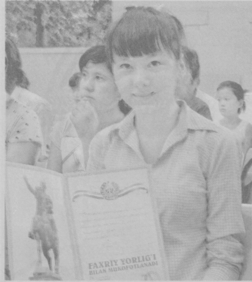
20 йиллиги арафасида ўтказилаётганлиги ҳам болалар қувончига қувонч қўшди.

Ўзбекистон Ноғиронлар жамияти, «Камолот» ёшлар ижтимоий ҳаракати Марказий кенгаши, Республика болалар ижтимоий мослашув маркази, Ўзбекистон Бадиий академияси, Маданият ва спорт ишлар вазирлиги, Ўзбекистон Республикаси Қасаба уюшмалари федерацияси Кенгаши, «Ўзбекнаво» бирлашмаси, Тошкент шаҳар ҳокимлиги, «Соғлом авлод учун» халқаро хайрия жамғармаси, «Sen yolg'iz emassan» Республика болалар жамоатчилик жамғармаси ташаббуси билан уюштирилаётган танловнинг навбатдаги финал босқичи Тошкент шаҳрида ўтказилди. Тузилган комиссия қатнашчиларнинг чизган расмларини кўриб чиққан ҳолда голиб ва совриндорларни аниқлади. Ҳақиқатан ташкилотчилар томонидан эсдалик совғалари билан тақдирландилар. Бу йилги кўрик-танлов мустақиллигимизнинг