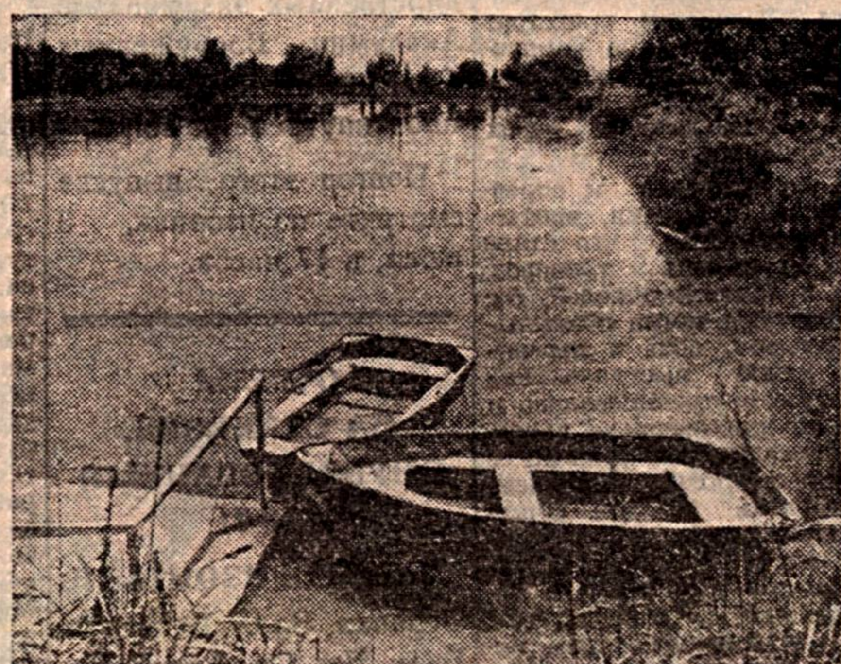
Бошқа жойни билмадик-у, лекин бизнинг жонажон ўзбекистонимизда ёз чоғи ҳовуз, анҳор, кўл бўйлариди сайр этиш жон роҳати. Айниқса, қайиқда сайр этишга нима етсин?! Исик тафтини сув салқини олади-да.

Чтобы ковры служили дольше, следует помнить некоторые вещи. Новые ковры и дорожки в первые шесть недель нельзя ни выбивать, ни чистить пылесосом, пока ворс ковра утапывается. В течение этого времени его можно чистить только щеткой. В дальнейшем ковер обрабатывают пылесосом, щеткой или специальной выбивалкой, для чего ковры и дорожки вешают изнаночной стороной наружу и затем выбивают. Ковровые изделия со значительным загрязнением можно протереть увлажненной солью. Яркость красок ковра зависит от его правильного расположения по отношению к свету. Проведя ладонью по ворсу ковра, можно определить, в каком направлении ворс жестче. Этой стороной ковер и должен быть направлен к солнцу.