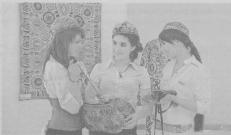
Миллий қадриятларимизни эъозлаш, халқ ҳунармандчилиги намуналаридан завқланиш, уларни яратиш сир-синаотига қизиқиш бугунги кун ёшларига хос хислатлардир.