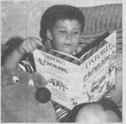
Рисование, танцы, чтение — обширен мир увлечений нашей детворы.