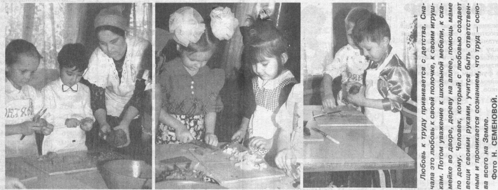
Любовь к труду прививается с детства. Сначала это любовь к своей полочке, к своим игрушкам. Потом уважение к школьной мебели, к скамейке во дворе, дереву на аллее, помощь маме по дому. Человек, который с любовью создает вещи своими руками, учится быть ответственным и проникается сознанием, что труд — основа всего на Земле.

Старая женщина жила одна. Когда ее спрашивали, почему она не переедет к единственному сыну, она коротко произносила: «Неуживчивая я». И сразу же заговаривала о чем-то другом. Если случалось, что при разговоре присутствовала ее ближайшая соседка и подруга тета Настя, то женщина, прежде чем произнести свой обычный, предупреждающий дальнейшие расспросы ответ, долго и как-то виновато смотрела на нее, словно умоляя помолчать. Но тета Настя молчать не умела: «Неуживчивая, все бы такими неуживчивыми были», — ворчала она и, сердито хлопнув калиткой, уходила к себе. Впрочем, долго сердиться подружка не могла. Не проходило и часа, как из соседнего двора раздавался ее зычный голос: «Мария, иди чай пить с оладьями, прямо с плиты, горячие».