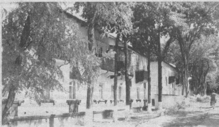
Зеленые улицы, залитые солнцем, — таков Ташкент в эти весенние дни.