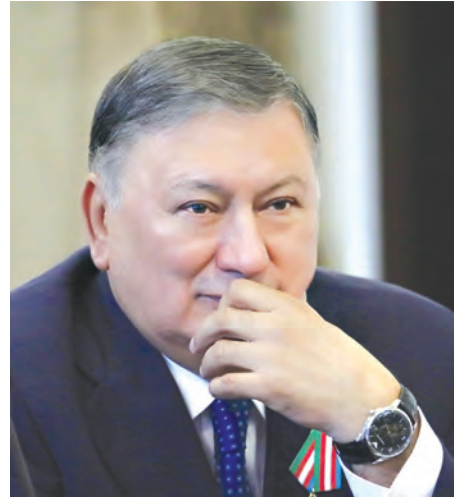
Кудратилла Рафиков. Политолог.

«Благодаря прочным историческим и личным дружеским связям между руководителями Узбекистана и Казахстана нынешнее состояние узбекско-казахских отношений характеризуется особой динамикой, взаимопониманием и высоким уровнем доверия. Считаю, что этот визит Президента Узбекистана в Казахстан имеет исто-