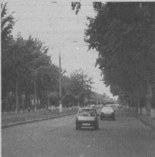
В этих местах бывал и я. Это мой город.

Специалисты разработали специальные таблицы, по которым, сравнивая свой тип кожи и ультрафиолетовый индекс на этот день, можно выяснить — стоит идти загорать или нет. В Британии ежегодно регистрируется до 70 тысяч новых случаев рака кожи.