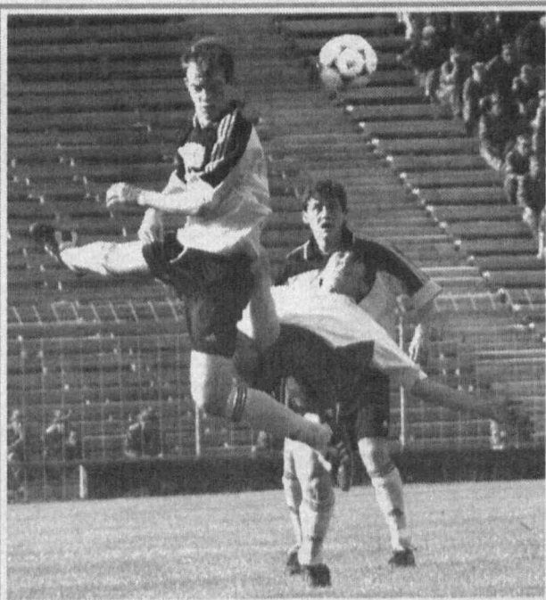
Чем не балет?..