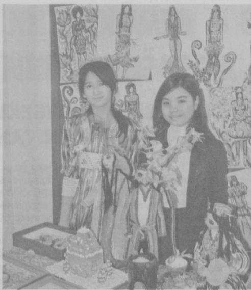
Қўли гул хунармандларимиз томонидан яратилган буюмлар бебаходир.