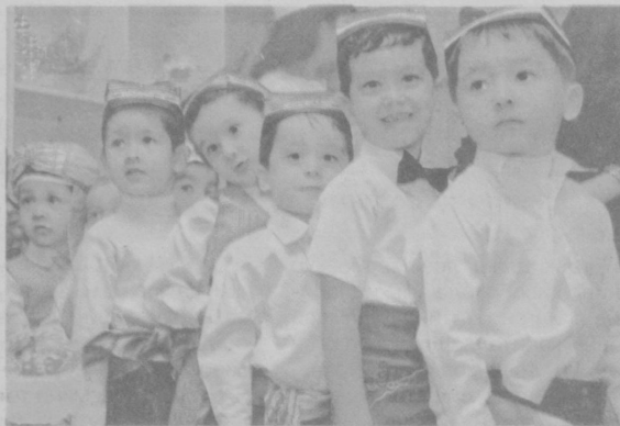
Истеъдодли ва иқтидорли болалар мустақил юртимиз келажакдир

Нигора ТўЛАГАНОВА