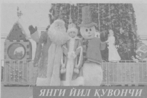
Янги йил қувончи