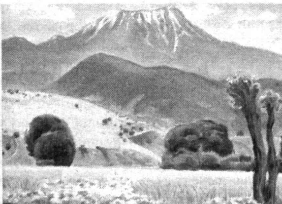
НА СНИМКАХ: художник Акрам Бахрамов; на выставке; работа, вошедшая в экспозицию.