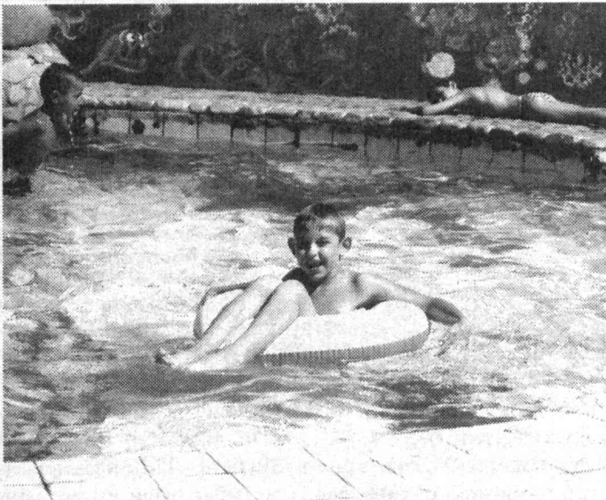
В парке имени Мирзо Улугбека отдых на любой вкус — можно сразиться в шахматы, поплавать в бассейне...