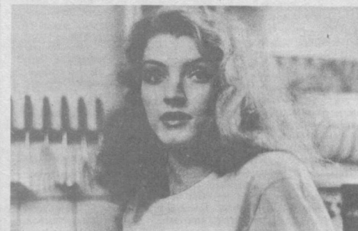
Ташкентская городская контора по прокату кинофильмов. Узбекское рекламное производственное предприятие ВПО «Союзреклама».