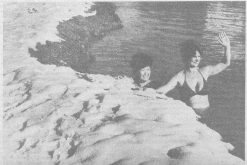
Анкор. Купальный сезон в разгаре.

дети одной цивилизации. На тридцати восьми объектах уже побывали ребята из «Доброй воли». Освобождают от битого кирпича, земли, мусора и кустарника останки некогда прекрасных зданий.