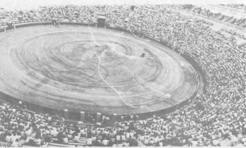
НА СНИМКЕ: Мадрид. Коррида.