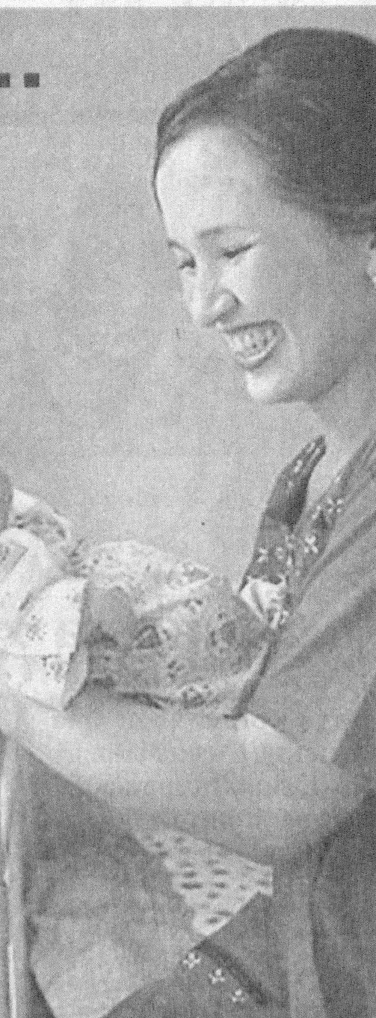
2002 йилда Жаҳон соғлиқни сақлаш ташкилоти Ўзбекистонга полиомиелитдан холи ҳудуд сертификатини тақдим этди.

Мутахассисларнинг фикрича, носоголом турмуш тарзи, болаларни эмлаш жараёнига тўлиқ қамраб ололмастик, тарғибот-ташвиқот ишларининг талаб даражасида олиб борилгани ҳам қўшни давлатлар ҳудудида ўткир шол хасталигининг пайдо бўлишига сабаб бўлган.