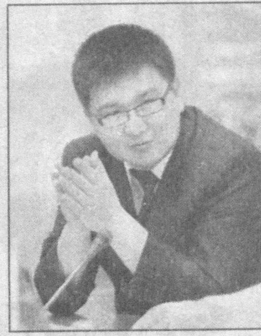
Умиджон ЭГАМБЕРДИЕВ, Халқ таълими вазирлиги маънавий-ахлоқий тарбия бошқармаси бошлиғи

Телефон аппаратидаги турли ўйинлар, SMS алмашув, клиплар тасвирларга берилиб кетиш нафақат таълим сифати, балки ёшларнинг руҳияти, соғлиғи, маънавиятига жиддий хавф солмоқда. Улар эса бу кони зарар экани, асосий вақти телефон билан банд бўлиб қолаётганини сезмайди.