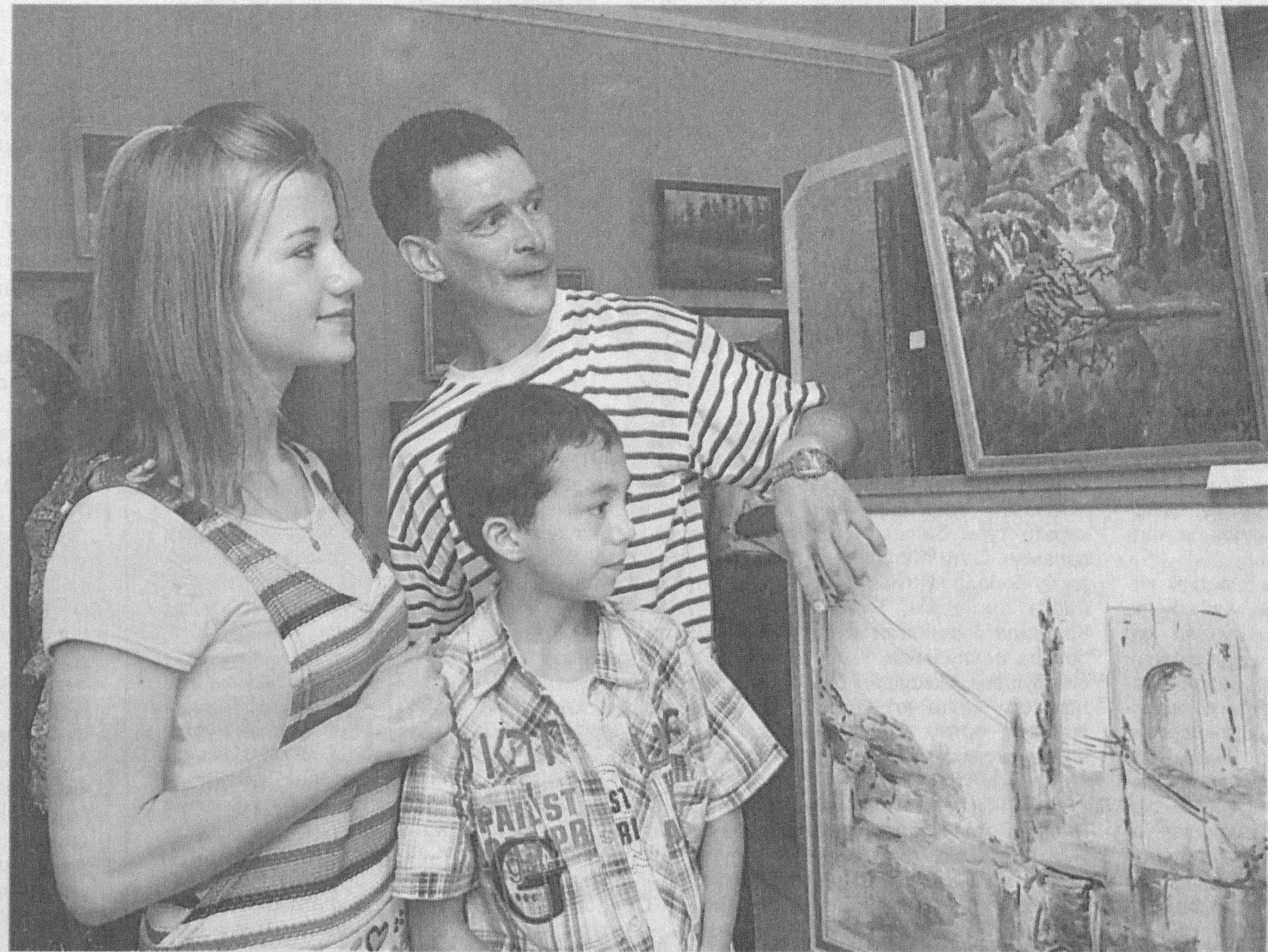
ЎзХДП фаоллари ташаббуси билан