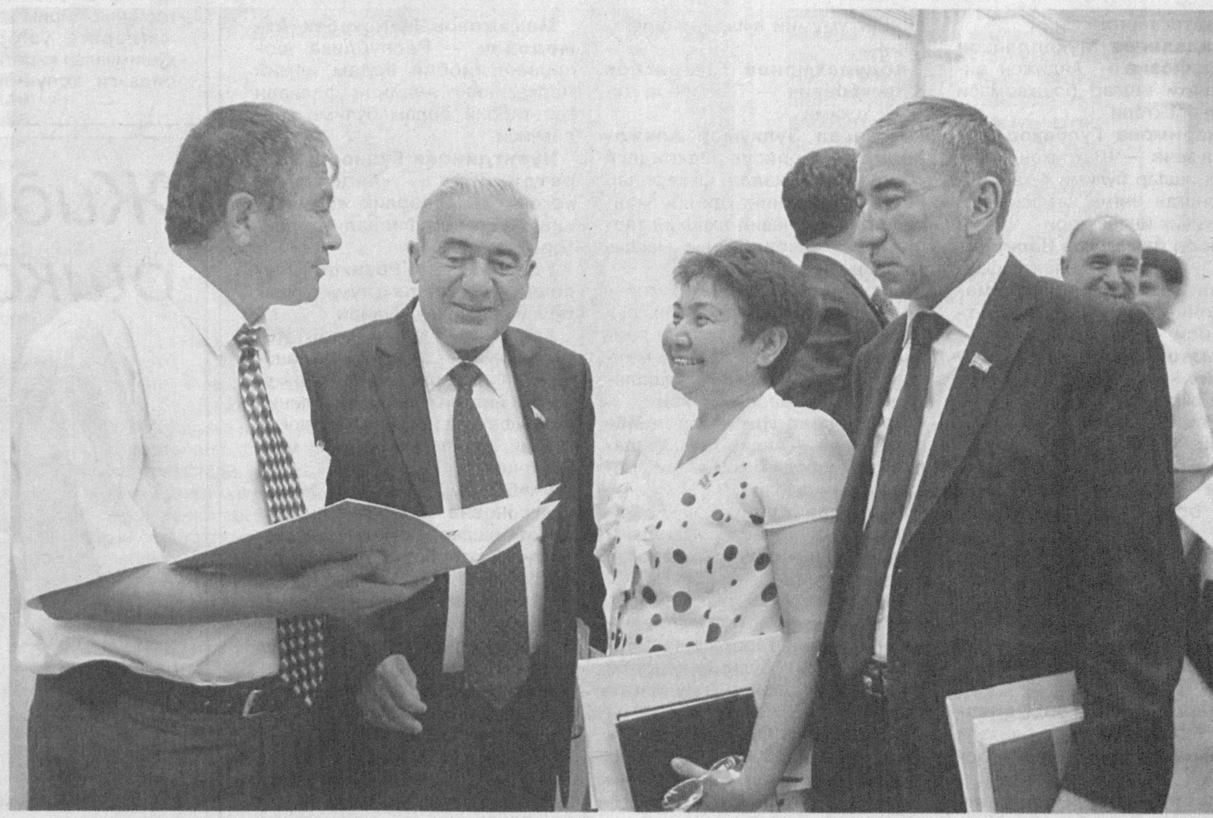
Этирраша НОМИРОВ ОЛГАН БУРАТ.