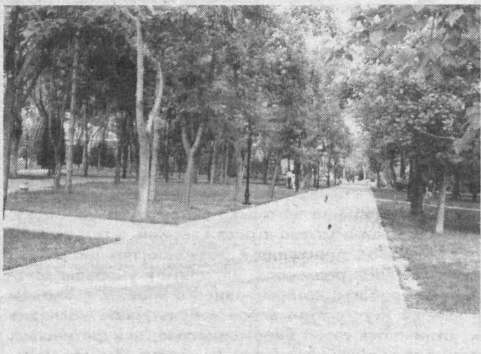
Немало в столице тенистых, уютных уголков, манящих зеленью и прохладой, зовущих сполна насладиться прелестью уходящих солнечных «золотых» осенних деньков.