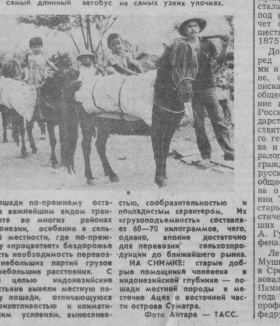
Лошади по-прежнему остаются важнейшим видом транспорта во многих районах Индонезии, особенно в сельской местности, где по-прежнему «процветает» бездорожье и есть необходимость перевозки небольших партий грузов на небольшие расстояния. С этой целью индонезийские крестьяне вывели местную породу лошадей, отличающуюся неприхотливостью к климатическим условиям, выносливо-