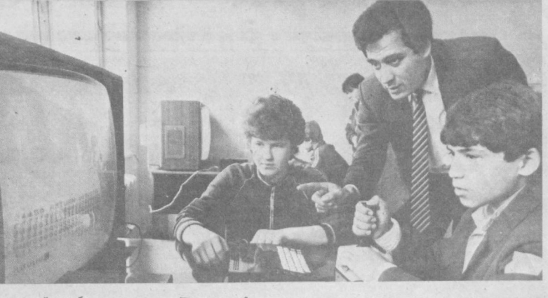
...тывающий в себя ягулу.

Разработан с участием «Нормы» и новый отделочный материал, практически не впи-