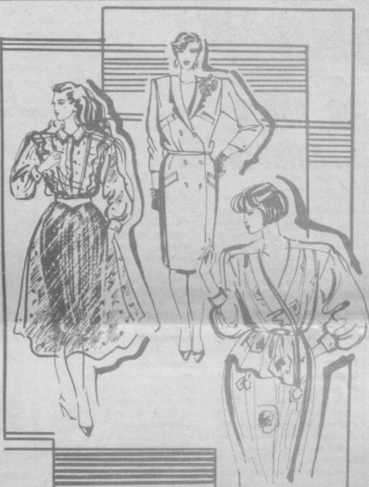
Ташкентстильшвейторг. Узбекское рекламное производственное предприятие ВПО «Союзречать» (телефон 45-37-24).

Транспорт — трамвай: 2, 16, 23, 28; троллейбус 21, остановка «Алайский рынок».