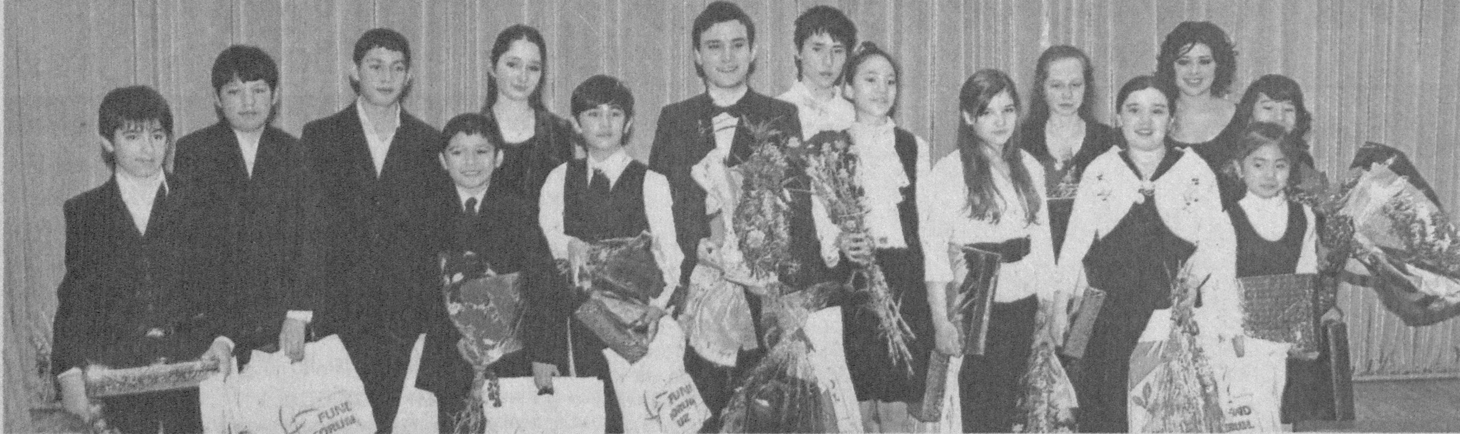
«Баркамол авлод йили» Давлат дастури амалда

«Бугунги кунда музика санъати навқирон авлодимизнинг юксак маънавий руҳида камол топишида бошқа санъат турларига қараганда кўпроқ ва кучлироқ таъсир кўрсатмоқда».