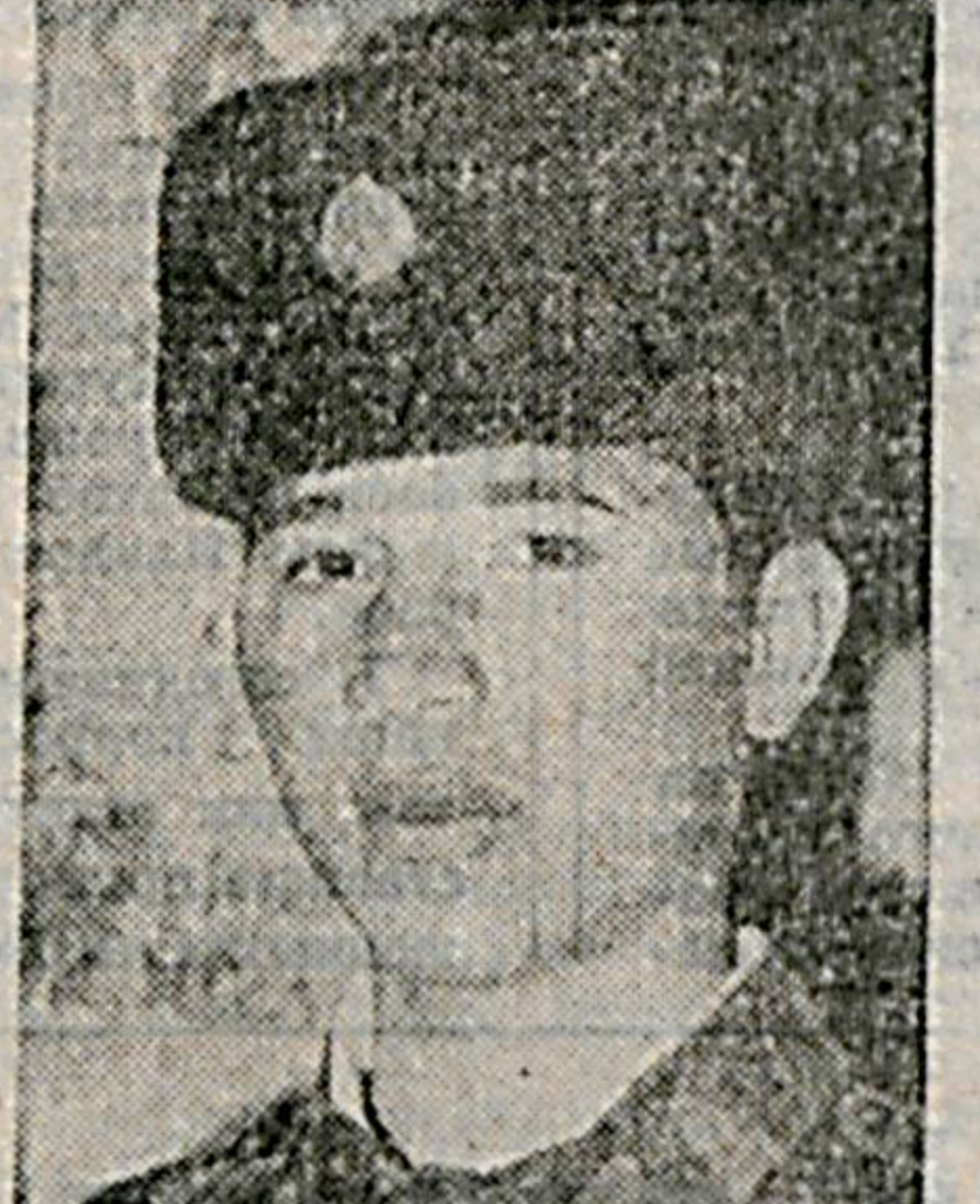
Разводящий, согласно уставу гарнизонной и караульной службы, отвечает за правильность и бдительность несения службы...