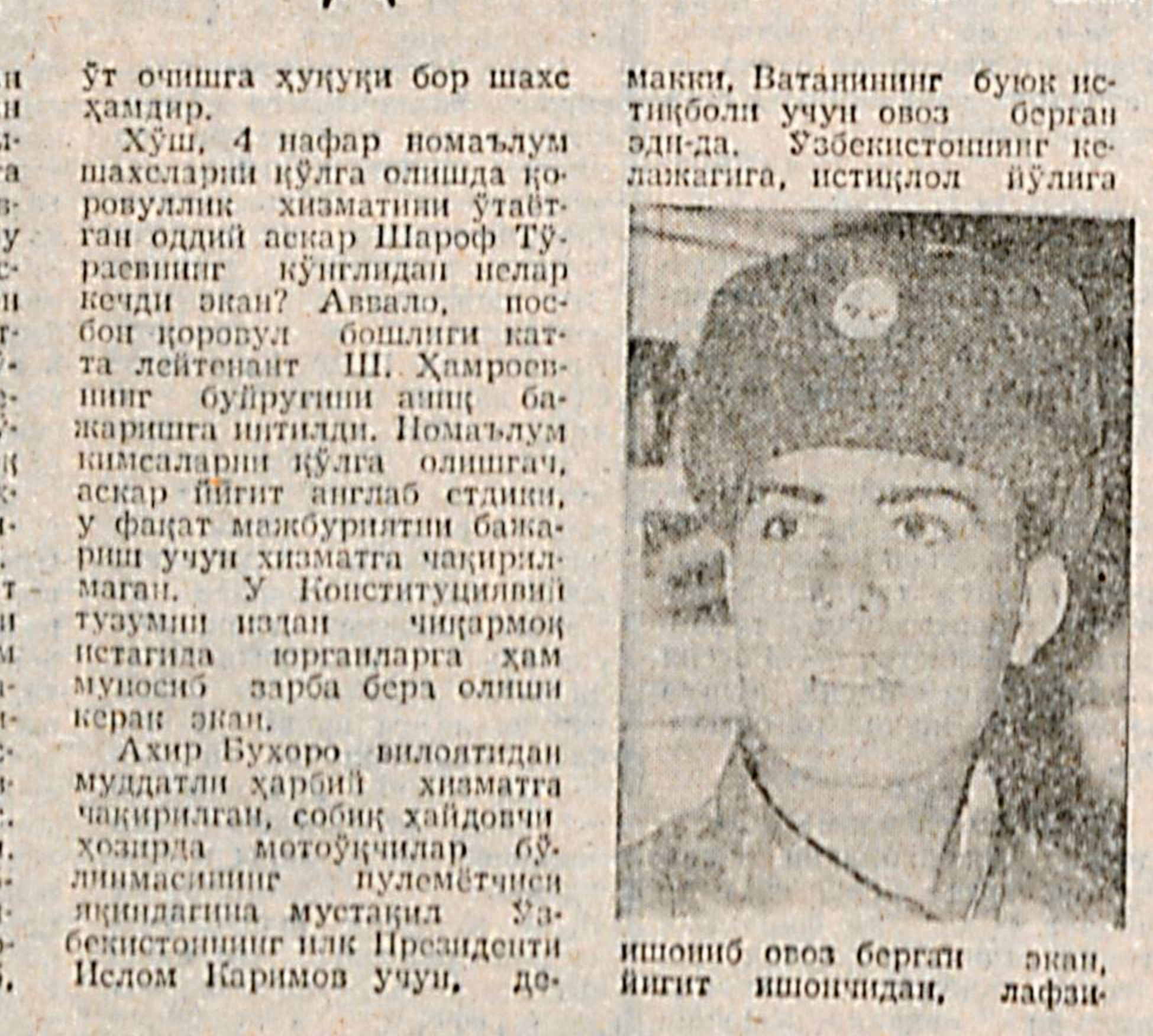
Разводящий, согласно уставу гарнизонной и караульной службы, отвечает за правильность и бдительность несения службы...