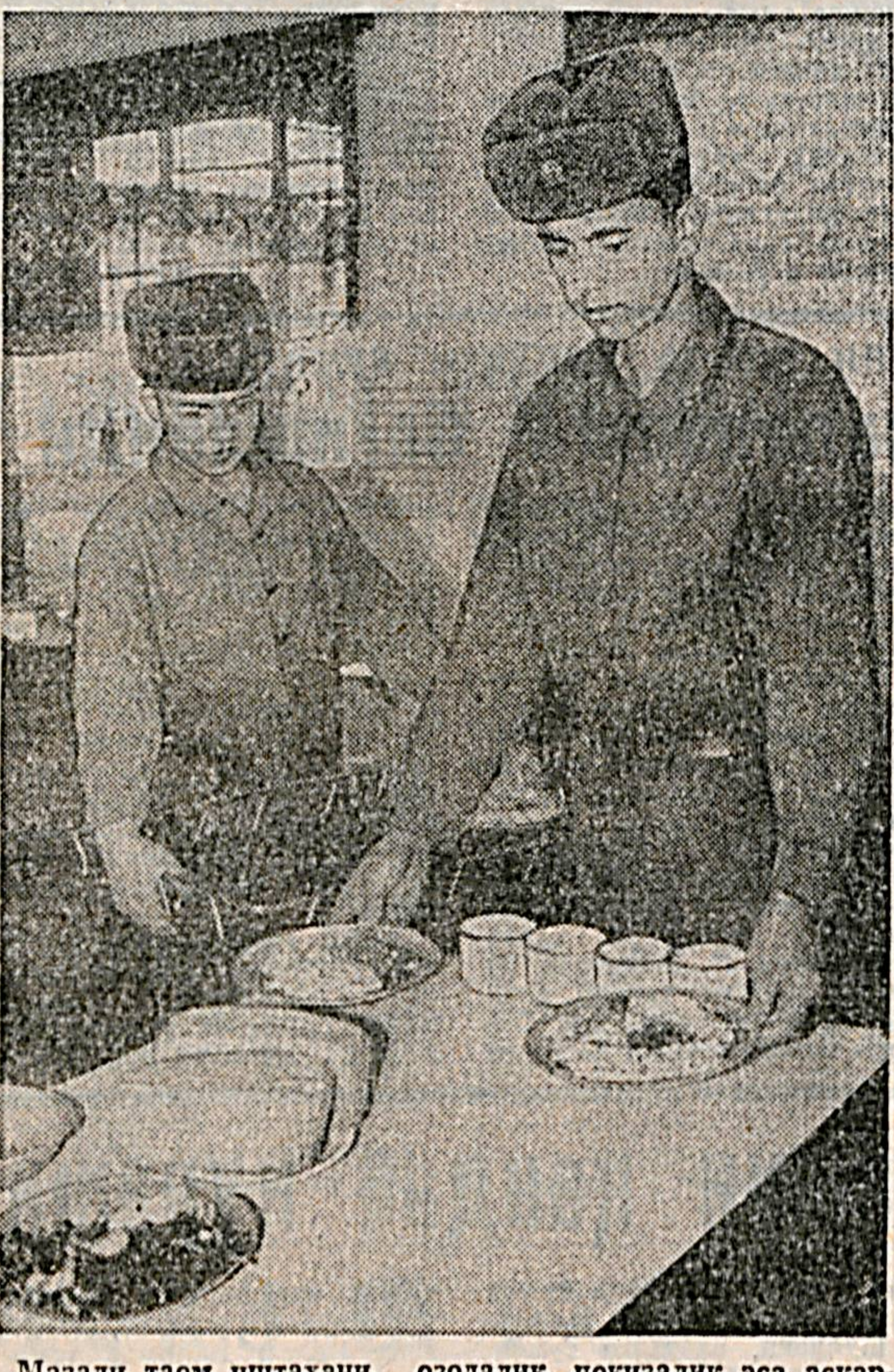
Мазали таом иштахани, озодалик, покизалик эса аскарнинг бахри-дилнин очади.