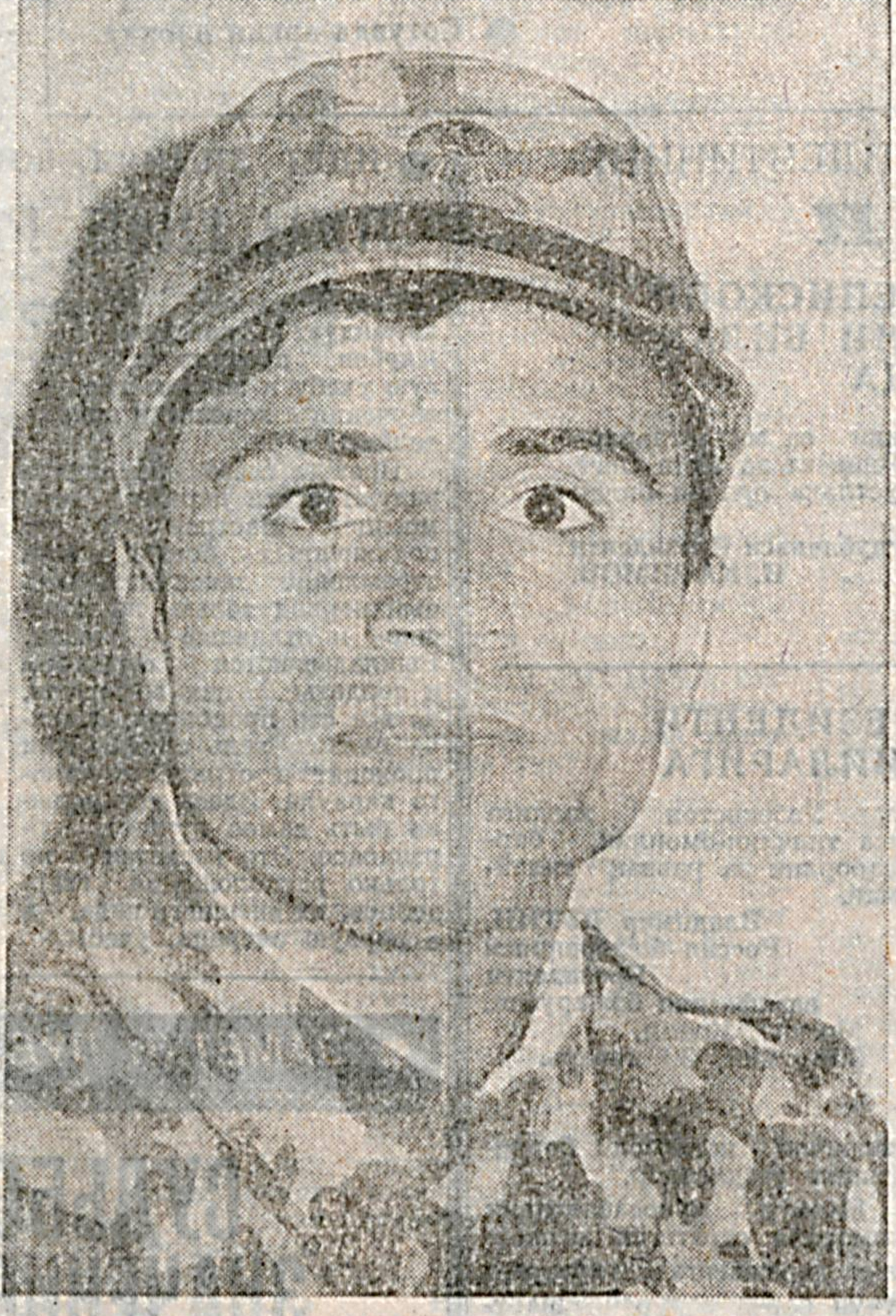
Разводящий, согласно уставу гарнизонной и караульной службы, отвечает за правильность и бдительность несения службы...

Песенка караульной службы является исполнением боевой задачи — вот, пожалуй, слова, и сжатой форме выражающие всю суть того, чем занимается личный состав караула.