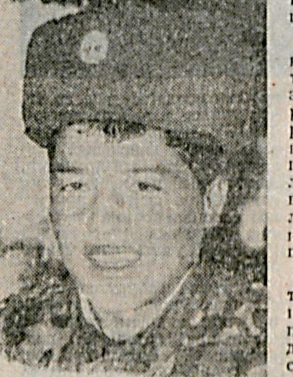
Разводящий, согласно уставу гарнизонной и караульной службы, отвечает за правильность и бдительность несения службы...