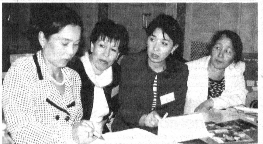
НА СНИМКЕ: участники конференции.