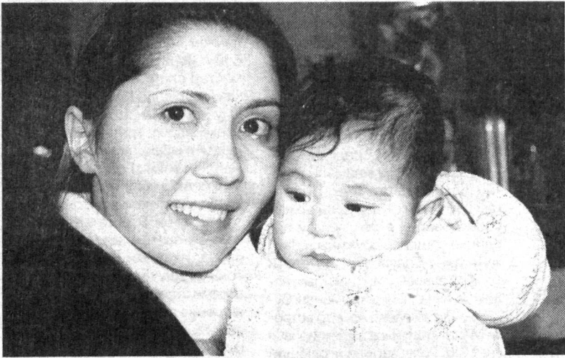
Мир детства прекрасен благодаря воспитанию и заботе со стороны родителей.