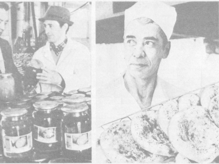
Звенья Продовольственной программы

— Так вопрос не стоит. Если на XXVIII съезде КПСС будет одобрено создание контрольно-ревизионных комиссий в целом, то конкретизировать эту идею будут уже сами партийные организации. Вопросы штатного расписания, количественного и качественного состава КРК, финансирования должны будут решаться партийными конференциями, которым КРК будут непосредственно подчиняться. Так что не думаю, что аппарат КРК будет очень больш-