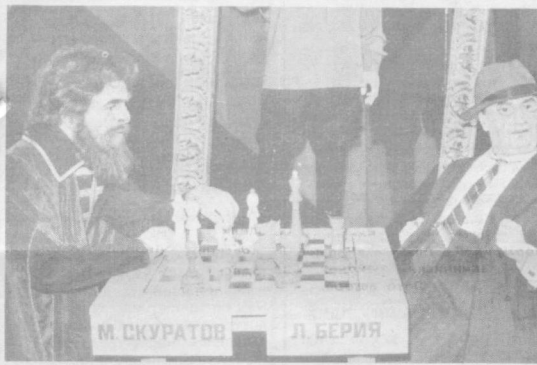
М. СКУРАТОВ — Л. БЕРИЯ