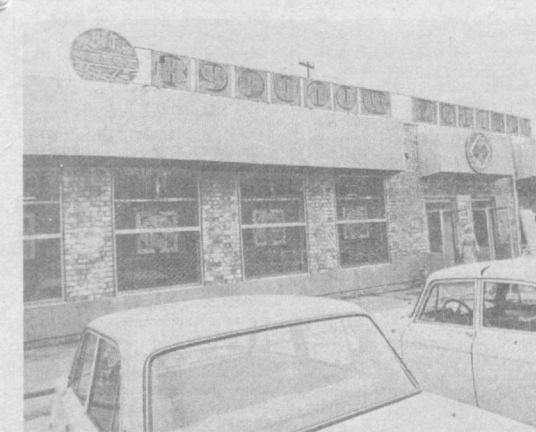
Для вас, горожане

вести в эксплуатацию инструментально-механический цех, после чего объем выпускаемой продукции увеличится на один миллион рублей. Но кое-кто встал на пути нам пути в колесо. Например, инженеры-проектировщики «Уагипромстрема» предоставили объединению совершенно неудачный проект нового жестяного цеха. В результате вывоз отходов из него производится вручную. В четвертом квартале объединения собирается собственный силами ввести в эксплуатацию механический склад сырья. Улучшаются и социальные условия. Во втором квартале текущего года намечается построить на территории универсальный магазин, собственными силами возводится новая чайхана и столовая на 100 посадочных мест. Коллектив предприятия, ориентируясь на перспективу, сделал первый шаг к заключению делового контакта с фирмами по организации совместного выпуска алюминийной продукции с декоративными рисунками. А. ГАЛИМОВ.