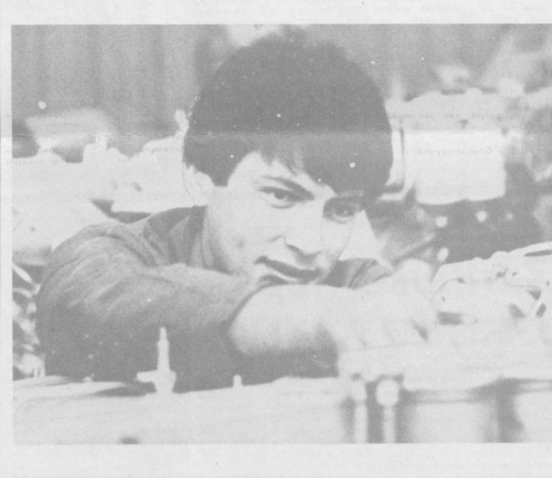
Интервью взял В. БРОНШТЕЙН.