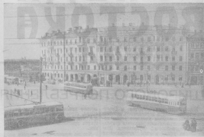
Станица Татарской АССР — Казань стала одним из крупных индустриальных и научных центров страны. На ее улицах вырастают красивые, многоэтажные дома. Только в течение первых двух лет этой пятилетки жилой фонд Казани увеличился почти на 70 тысяч квадратных метров. На снимке: новый многоквартирный жилой дом на площади имени В. В. Куйбышева.