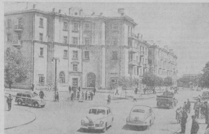
Сталинская область. Новые жилые дома для металлургов в г. Макеево.

На предприятиях, в колхозах и учреждениях Мордовии проводятся беседы и доклады о жизни и творческой деятельности поэта. В библиотеках, клубах, домах культуры, избах-читальнях будут проводиться литературные вечера и читальские конференции, организованы выставки произведений поэта, изданных на русском и мордовском языках.