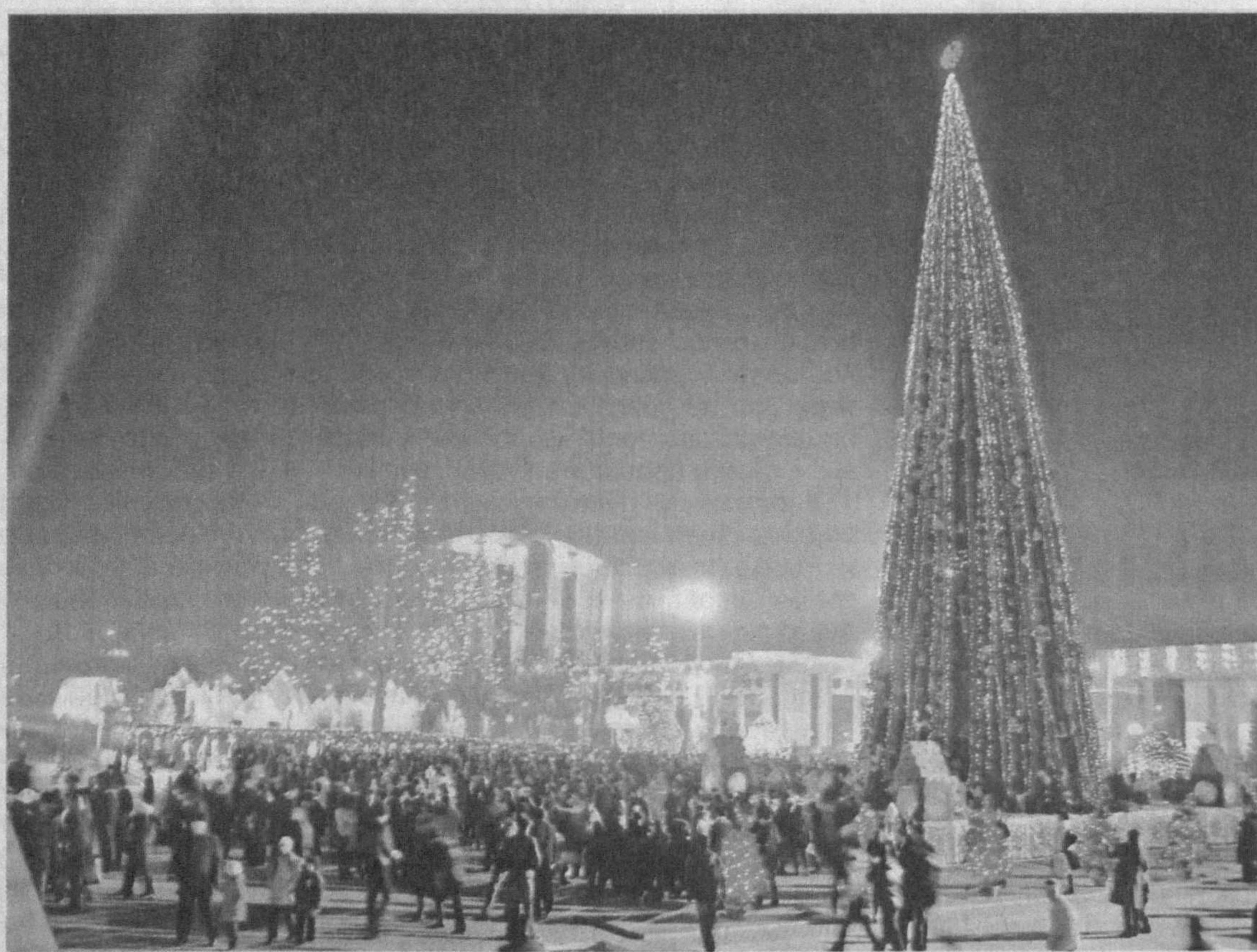
Зимние школьные каникулы веселая и радостная пора. Каждый их день у детворы расписан по минутам. Ведь так много интересных представлений необходимо посетить.