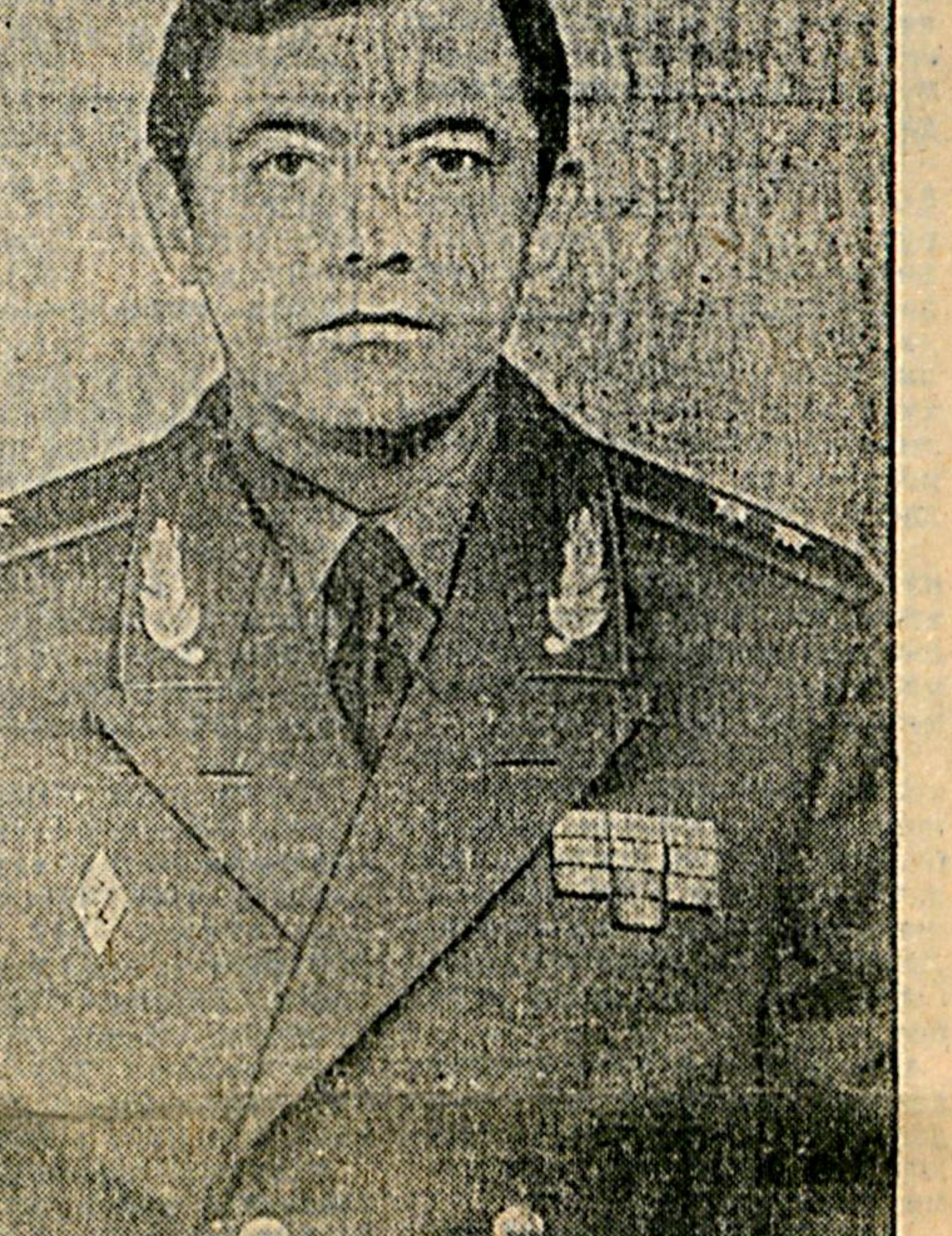
Генерал-лейтенант Агзамов Юрий Набиевич родился 4 августа 1949 г. в г. Ташкенте. В 1970 г. окончил Ташкентское высшее танковое команд- ное училище. Служил на должностях командира взвода, командира роты, начальника штаба — заместителя командира танкового батальона. В 1977 г. окончил командный факультет Военной акаде- мии бронетанковых войск. После окончания академии служил бу проходил на должностях командира батальона, началь- ника штаба — заместителя командира полка, командира танкового полка, военного комиссара Лидиянской области, начальника Чирчинского высшего танкового командно-инже- нерного училища, заместителя Министра обороны Респу- блики Узбекистан по боевой подготовке, заместителя Ми- нистра обороны Республики Узбекистан — командующего войсками Юго-Западного особого военного округа. Женат, имеет двоих детей.

Ушбу Президентнинг Фармони билан Агзамов Юрий Набиевич таъинланган. Министр оқибати бўлиб қолган.