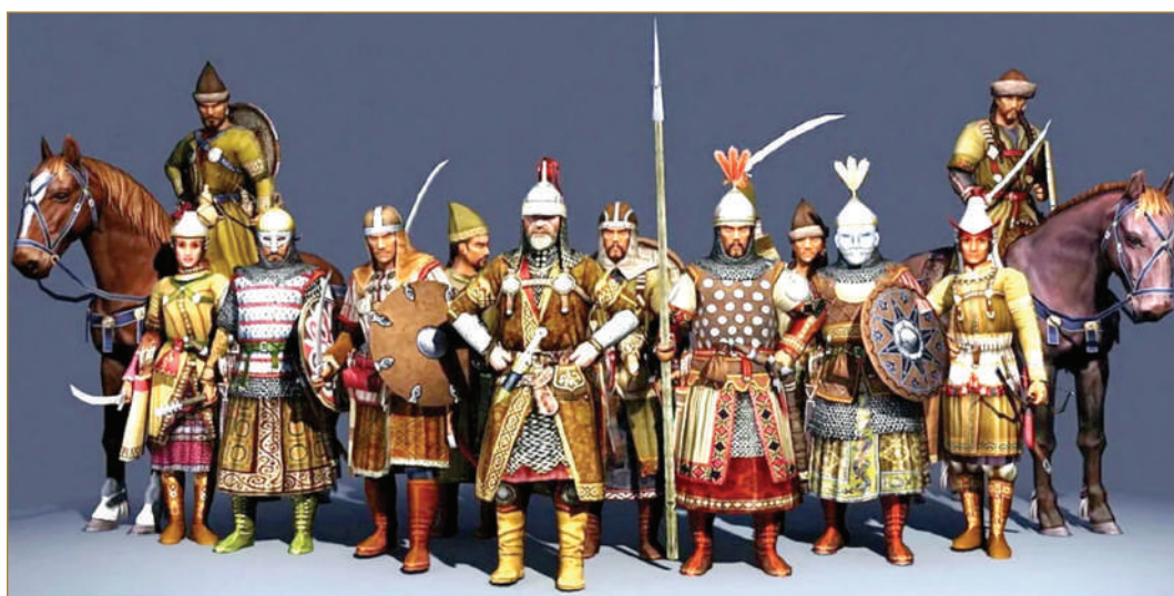
Bajanaklar – Sharqiy Ovro'podagi gagauz (ko'ko'g'uz) xalqi ajdodlari.

Shuningdek, o'zbek va tojik tillarida opaning yoki yaqin qarindoshning eriga nisbatan "pochcha" ("pochcho") so'zi ishlatiladi (shevalarda: "bexchxo", "guyev pexchxo", "kuyev pexchxo", "jezde", "jezze", "yezde", "yazna"). "Turkiy tillarning etimologik lug'ati"dan ko'rinadiki, "boja" so'zi ba'zi turk xalqlari tillari, shevalarida "paja", "pacha",