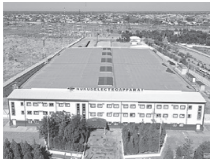
Президент Қорақалпоғистон Республикасидаги "NUKUS ELECTROAPPARAT" кўшма корхонаси фаолияти билан танишди.