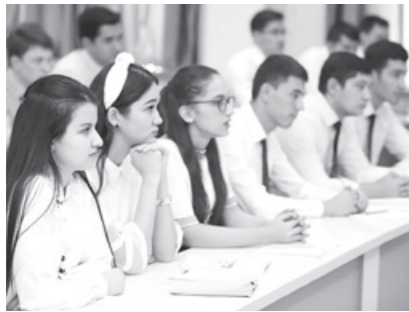
Тест синовлари натижаси бўйича АПЕЛЛЯЦИЯ шикоятларини кўриб чиқиш 22 августдан бошланади.