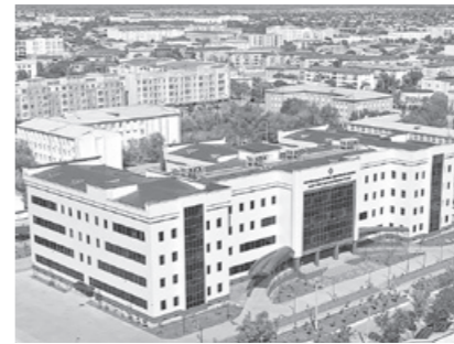
Президент Республика шошлинч тиббий ёрдам илмий маркази Қорақалпоғистон филиалидаги Шароитлар билан танишди.