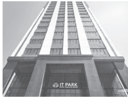
Давлатимиз раҳбари IT-паркнинг Қорақалпоғистон филиалини бориб кўрди.