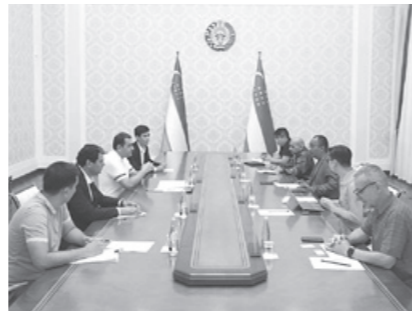
Фарғона туманида қуввати 200 мегаватт бўлган КУЁШ ЭЛЕКТР СТАНЦИЯСИ қурилади.