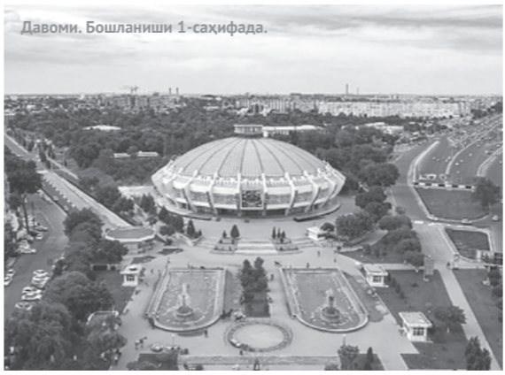
Давоми. Бошланиши 1-саҳифада.

Унга кўра, эндиликда Тошкент шаҳри ва Тошкент вилояти учун алоҳида, бошқа вилоятлар учун алоҳида рўйхатга олиш тартиби бўлмади, бундай амалиётдан воз кечилди, республика бўйича бир хил тартиб амал қилади. Бундан ташқари, Маъмурий жавобгарлик тўғрисидаги кодексга ўзгартириш киритилиб, ўн саккиз ёшгача бўлган, олти ёшдан ошган ёки тўлиқ давлат таъминотида бўлган шахслар эндиликда паспорт тизими қоидаларини бузганлик учун жавобгарликдан тўлиқ озод этилади.