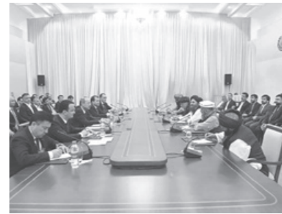
Ўзбекистон ва Афғонистон ўртасида ИМТИЁЗЛИ САВДО КЕЛИШУВИ ишга тушади.