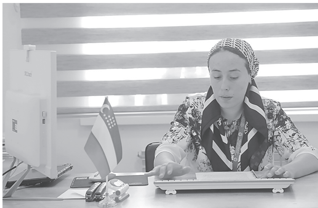
"Тинчлик" маҳалласида ота-она қаровисиз қолган 10 нафар боланинг 4 нафари васийликка, 6 нафари эса ҳомийликка берилган. 2 нафар болажонлар уйда таълим олади.

Қоракўлик Шозода опа Аллобердиева узок йиллар туман алоқа бўлимида иш-